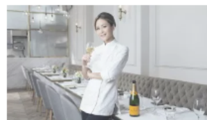
È Vicky Lau la Veuve Clicquot Asia's Best Female Chef 2015 30/01/2015 In "People"