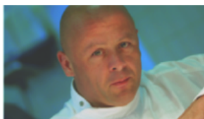
Mandarin Oriental 08/01/2013 In "Hotel & Resort"